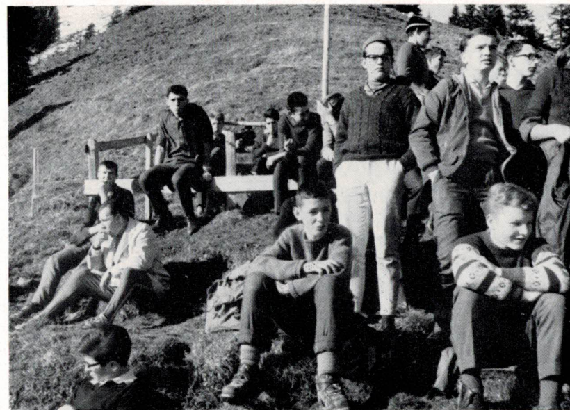
«Weltanschauung» der Konviktisten!

Gefunden in der Kegelhalle: Lateinübungsheft, Namensträger besagter Nummer. Kleiderkasten-Revision: Panorama eines nachsintflutlichen Katastrophengebietes. Hamsternest eingesammelter Schachtelkäse und abgefüllter Konfitüre. Delinquent zur Rede gestellt: ein unbesorgtes Bubengesicht, das sich kaum zu einer Sorgenfalte durchringt, es sei denn die Kulisse eines problemlosen Herzens. Wie